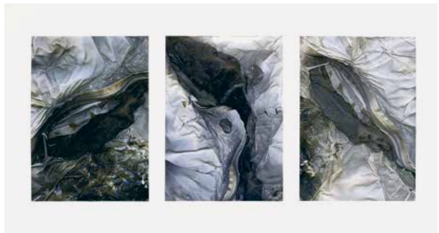
Nikola Ivanov: Poslední výzva (s Richardem Janečkem), 2016, kombinovaná technika, Galerie Jelení