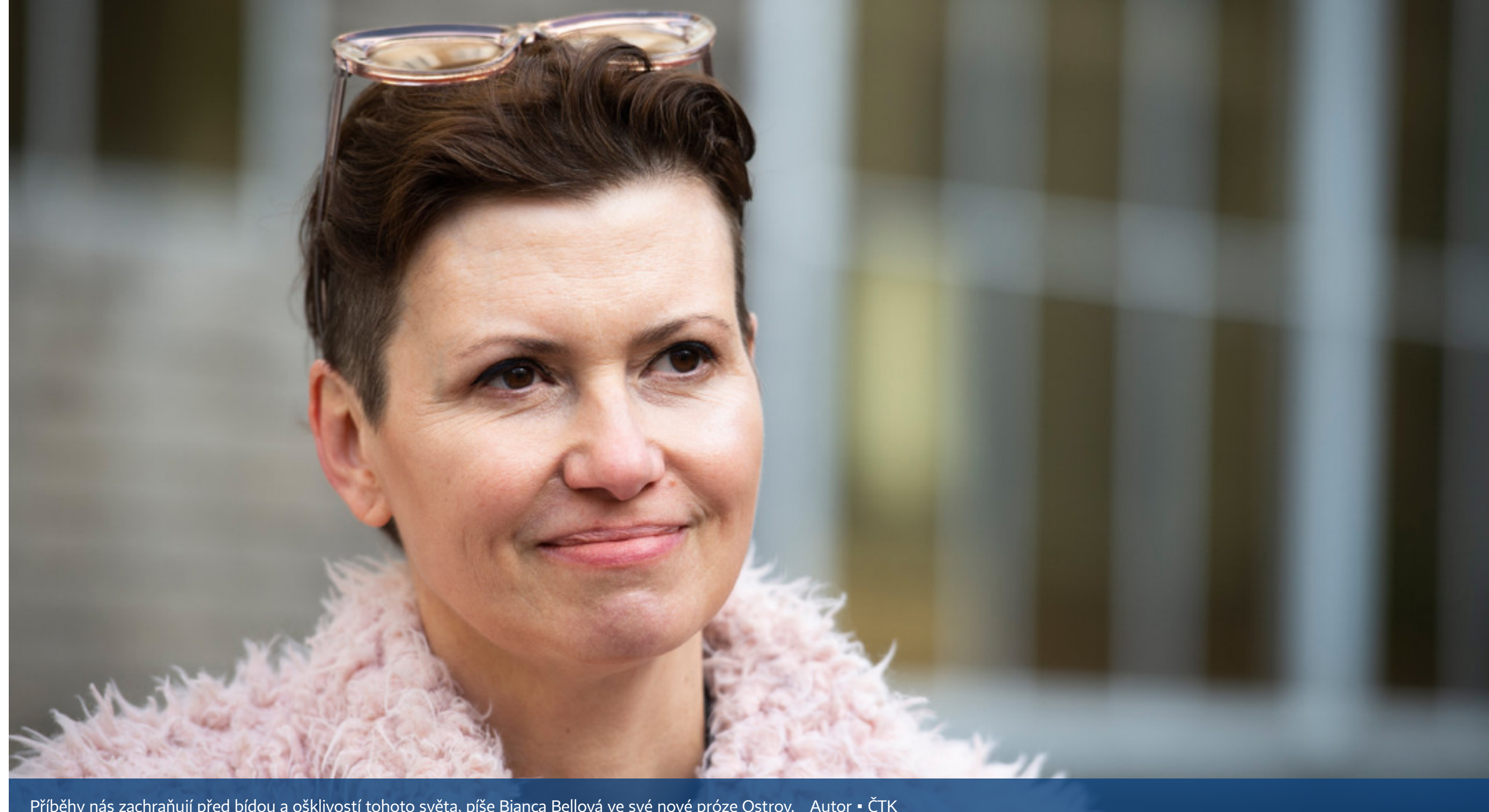
Příběhy nás zachraňují před bídou a ošklivostí tohoto světa, píše Bianca Bellová ve své nové próze Ostrov.

Anna Stejskalová 13. 5. 2022 00:00 • 3 min čtení