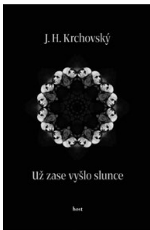
J. H. Krchovský Už zase vyšlo slunce Host, Brno 2022 64 stran