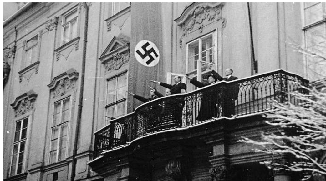
Úřad protektora v Brně Představitelé nacistického režimu hajlují na balkoně úřadovny říšského protektora, který sídlil v budově Nové radnice na dnešním Dominikánském náměstí.

„Nacistická okupace, holocaust, poválečný odsun Němců i období komunismu z Brna učinily město, kde se nevzpomíná právě snadno. Přesto je takové vzpomínání užitečné už proto, že nebezpečí návratu totality nelze nikdy vyloučit,“ dodávají autoři. Jana Soukupová