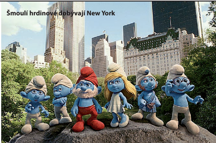
Šmoulí hrdinové dobývají New York

Zaplavili kina, aktuálně i supermarkety. Ano, jde o bleděmodré trpaslíky, které poprvé nakreslil belgický výtvarník Pierre Culliford pro komiks, a kteří se pak stěhovali do televize a posléze do filmu. Ovšemže ve 3D. Animovaný film Šmoulové natočil Raja Gosnell – jeho drobné, leč neodbytné akční postavičky prožívají svá dobrodružství společně s několika živými herci. Vydávají se z bezpečné šmoulí vesničky do velkoměsta plného nástrah.